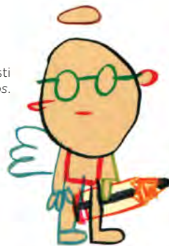
Ilustración de Gusti para No somos angelitos .