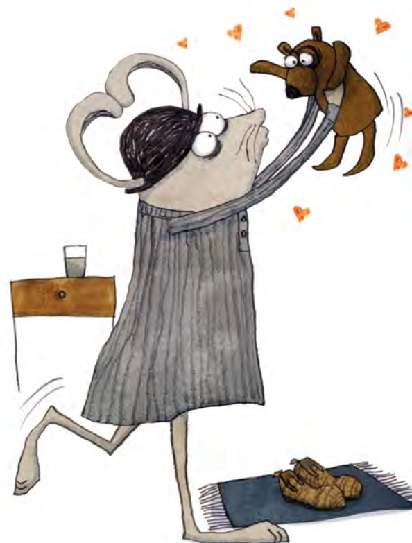
Ilustración de Kris Di Giacomo para ¡Quiero dormir!

Texto e ilustr.: Séverin Millet Lóguez, 2017 978-84-947052-3-6