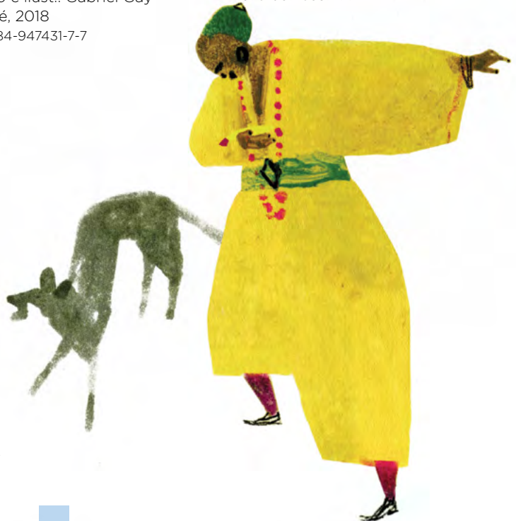
Ilustración de Jesús Cisneros para El príncipe moro y el pescadito de oro .

Texto: Ninah Basic Ilustr.: Eden Mir Cidcli, 2015 978-607-8351-44-2